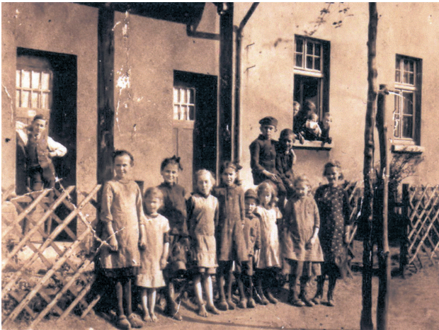
Mein Elternhaus - in der Tür angelehnt der Bruder meiner Mutter, vordere Reihe die 5. v.l. meine Mutter und die 3. v.l. die Schwester meiner Mutter